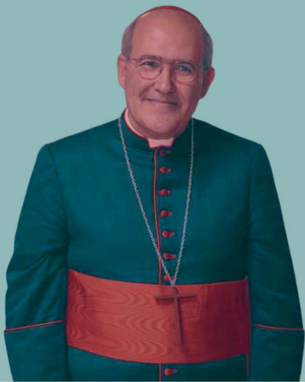
CARDEAL D. JOSÉ TOLENTINO MENDONÇA

O QUE TE PEÇO, SENHOR, É A GRAÇA DE SER. NÃO TE PEÇO MAPAS, PEÇO-TE CAMINHOS: O GOSTO DOS CAMINHOS RECOMEÇADOS, COM SUAS SURPRESAS, SUAS MUDANÇAS, SUA BELEZA. NÃO TE PEÇO COISAS PARA SEGURAR, MAS QUE AS MINHAS MÃOS VAZIAS SE ENTUSIASMEM NA CONSTRUÇÃO DA VIDA. NÃO TE PEÇO QUE PARES O TEMPO NA MINHA IMAGEM PREDILETA, MAS QUE ENSINES MEUS OLHOS A ENCARAR CADA TEMPO COMO UMA NOVA OPORTUNIDADE. AFASTA DE MIM AS PALAVRAS QUE SERVEM APENAS PARA EVOCAR CANSAÇOS, DESÂNIMOS E DISTÂNCIAS. QUE EU NÃO PENSE SABER JÁ TUDO ACERCA MIM E DOS OUTROS. MESMO QUANDO EU NÃO POSSO OU QUANDO NÃO TENHO, SEI QUE POSSO SER, SER SIMPLEMENTE. É ISSO QUE TE PEÇO, SENHOR: A GRAÇA DE SER DE NOVO.